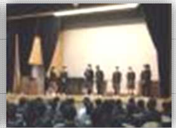
生徒会による 専門委員会紹介