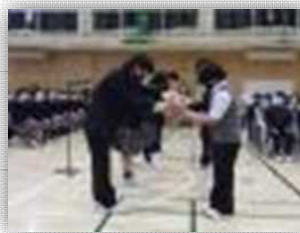
在校生から花の贈呈

新入生歓迎会と部活動説明会を行いました。新入生歓迎会では、生徒会が中心となって学校のルールや各委員会について劇を通して紹介しました。新入生は楽しみながら学校について理解することができました。