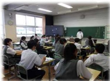
授業の様子(1年国語)

小学生は、少人数のグループで、5校時に希望する授業を、6校時は部活動の様子を見学しました。小学生の授業と中学生の授業における内容の違いや、真剣に授業・部活動へ取り組んでいる姿に、多くの児童が興味津々で見学していました。小学生に、先輩らしいかっこいい姿をみせることができました。