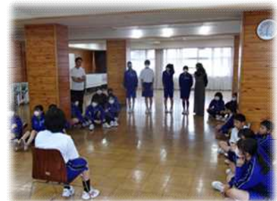
コミュニケーション能力向上授業の様子(1年生)