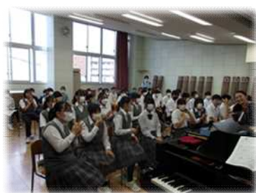
授業の様子(3年音楽)