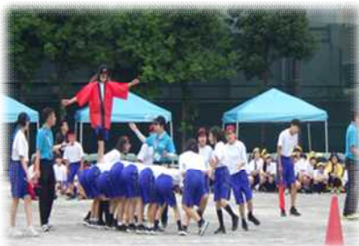
1年生 いかだながし

今年度は、第15回記念として、南中野中・第一中・中野富士見中三校の校歌のメドレーマーチを吹奏楽部が演奏し、4年ぶりに全校による入場行進をしました。スローガン「新時代へ Here we go!!」のもと、新しい南中野中学校を創りあげるような素晴らしい運動会となりました。生徒が主体となって、競技やルールを決めたプログラム構成となり、クラスや学年・学校全体で団結・協力する姿が多く見られました。平日開催にもかかわらず、多くの保護者の皆様、地域の皆様に見守っていただきました。たくさんのご参観、ありがとうございました。