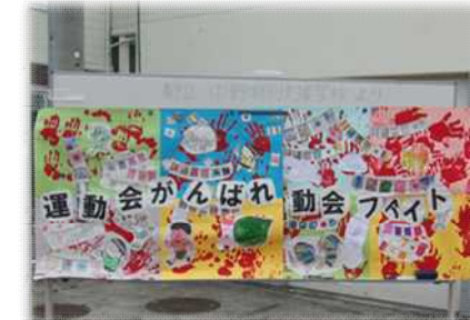
中野特別支援学校との交流