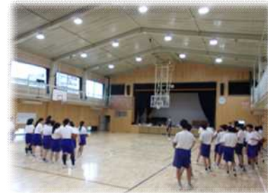
部活動見学の様子 (バスケットボール部)