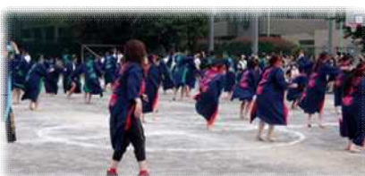
学年全体でのソーラン総踊りの様子

生徒アンケートでは、「運動会当日は、一生懸命前向きに取り組めた97.9%」、「クラスや学年に貢献できた92.9%」、「運動会には活躍の場が多くあった88.5%」と、達成感や自己有用感を得ることができたよい経験になりました。