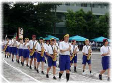
入場行進(吹奏楽部)