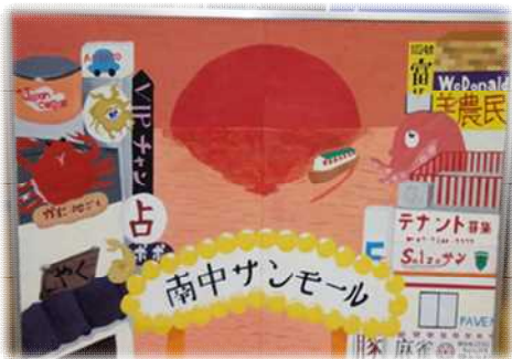
「南中サンモールのその向こう」