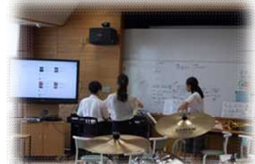
合唱指揮者・伴奏者の練習