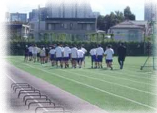
中野区連合陸上の練習