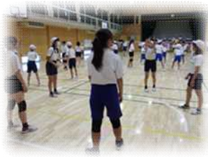
部活動体験 「バレーボール部」