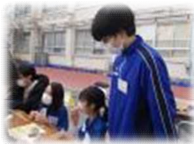
割りばし鉄砲工作