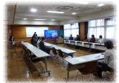
学校医の先生方から