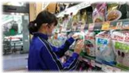
ペットの専門店コジマ

職業体験では、中野区専門学校協会の協力により、7校の専門学校の先生方による8種類の講座を実施することができました。それぞれの職業について体験し、様々な職業について実際にどのように働いているのかを知ることができました。