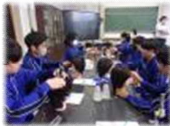
美容・カット体験