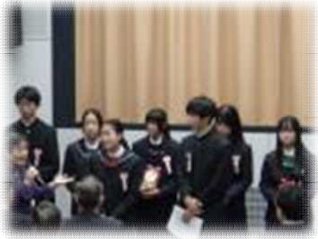
司会者を労う様子

12月9日(土)になかのZERO本館視聴覚ホールで、第35回中学生意見発表会が行われました。中野区内の中学校の代表が日頃から考えていることなどを自由に発表する催しです。本校からは、2年生女子が参加して、「ありがとう」という題名で、周囲の人々の温かい気持ちを大切に生きていきたい、という意見発表を行いました。また、2年生の男女生徒が司会をしました。場内の方から多数の温かい拍手をいただきました。