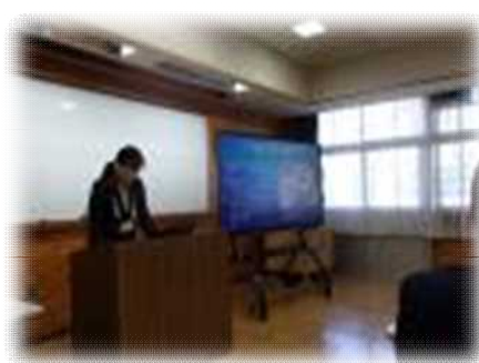
給食について報告