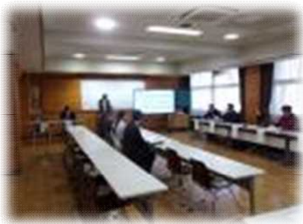
学校保健委員会の様子

学校給食衛生管理委員会では、給食室内における衛生管理の確認について協議しました。また、学校栄養士から、参加されている保護者の方に向けて、普段の給食の様子についてもお話させていただきました。