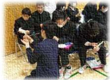
仕事の体験の様子