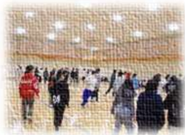
夜は生徒が考えた レクリエーションを行いました