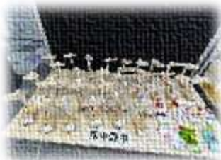
技術科・家庭科作品