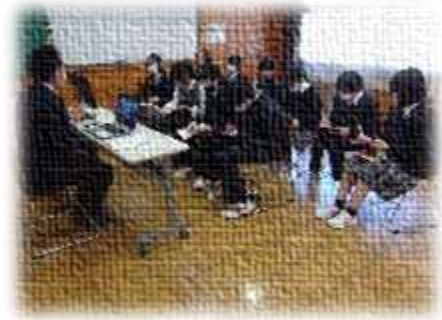
真剣に話を聴きメモをとる生徒

1月26日(金)5・6校時、12の事業所の方をお招きして、職業講話「南中ミライプロジェクト」を実施しました。生徒は自ら3つの事業所を選び、事業所の方から職業や仕事に関する話を聴き、働く上で大切なことや自分の将来について考えました。生徒アンケートでは、信頼を得ることの大切さや失敗から成長することについて学んだと振り返っていました。