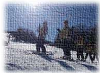
3日間晴天に恵まれ、 楽しく過ごせました