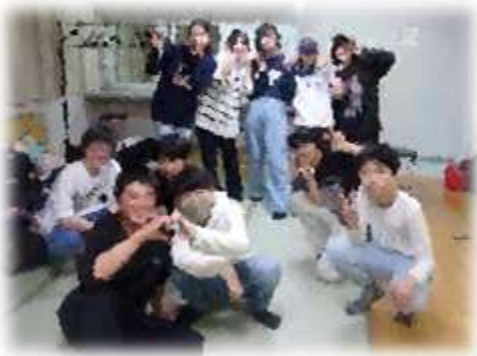
ダンス部講演会(楽屋にて)

○堀越高校ダンス部卒業公演 1年生の中から選出された 2チーム11名が出場しました。