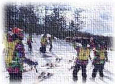
スキー実習の様子

健康管理から当日の準備まで、保護者の方の支えがあり、楽しくスキー教室を終えることができました。ご協力ありがとうございました。