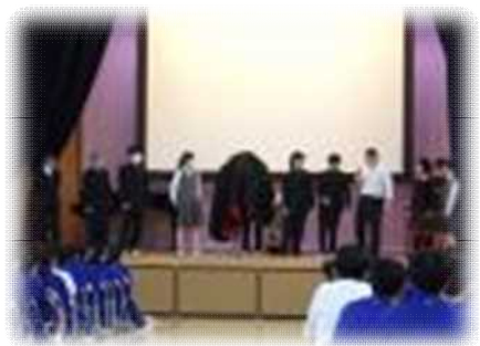
生徒会による専門委員会紹介

新入生歓迎会と部活動説明会を行いました。新入生歓迎会では、生徒会が中心となって学校のルールや各委員会について劇を通して紹介しました。新入生は楽しみながら学校について理解することができました。