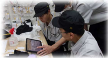
マクドナルド新中野店