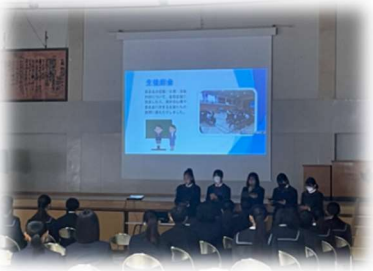
南中の取組を発表する様子