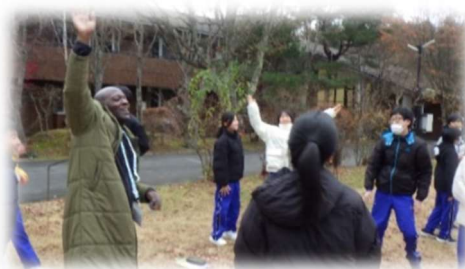
スカベンジャーハント