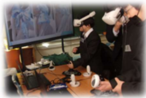
エアライン業界体験